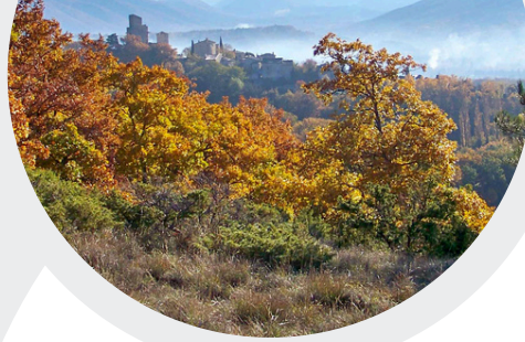
Montagne et contreforts du Vercors

Ces groupes permettent d'échanger entre élus de secteur et alimentent les travaux du bureau d'études. Ils sont une instance de réflexion et de propositions. Ils sont composés d'au moins un représentant par commune.