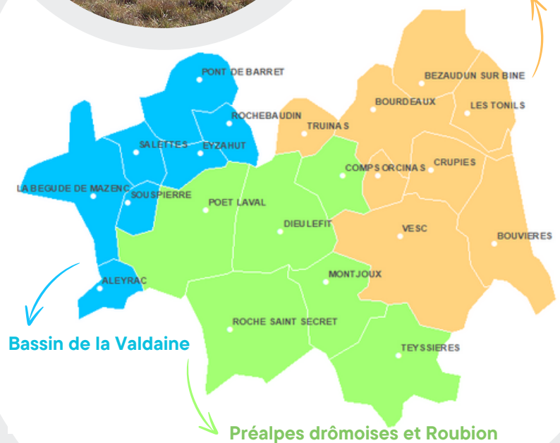
Schéma de gouvernance